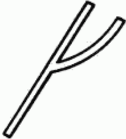
Оба конца прямые или (иногда) один закруглен