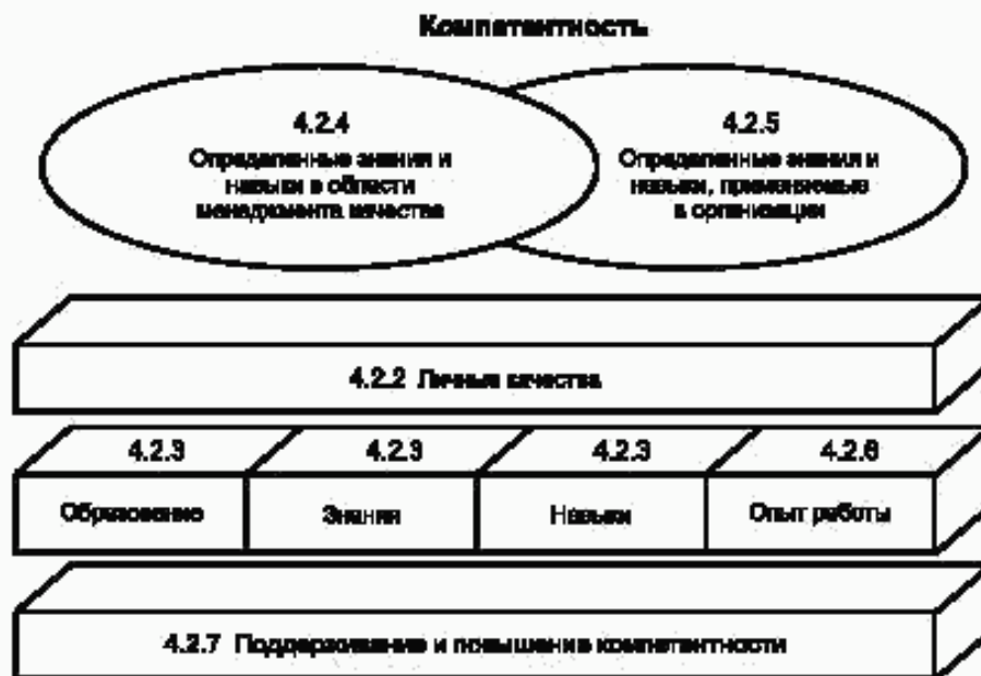
Рисунок 1 — Концепция компетентности консультанта по системам менеджмента качества

Примечание — Термин «компетентность» определен в ИСО 9000 как выраженная способность применять свои знания и умение.