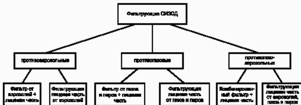
Рисунок 3 — Классификация фильтрующих средств индивидуальной защиты органов дыхания

Классификация фильтрующих СИЗОД представлена на рисунке 3.