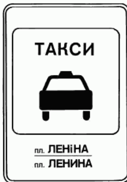
7. Указатель остановки легковых такси