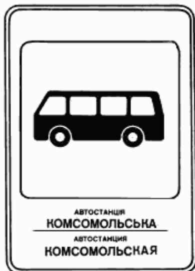
5. Указатель остановки междугородных автобусов