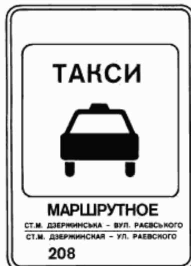
6. Указатель остановки маршрутных такси