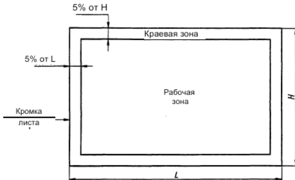
Рисунок 2 – Осматриваемые зоны стекла с покрытием конечного размера