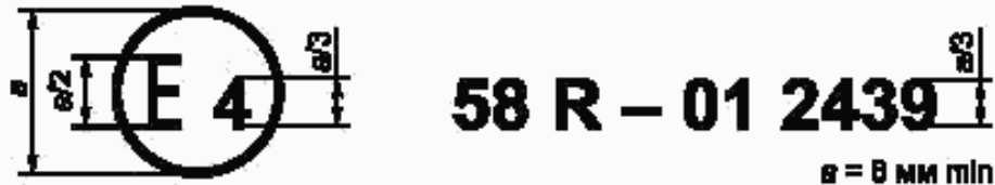
Образец А (См. 6.4, 15.4 и 24.4 настоящих Правил)

Приведенный выше знак официального утверждения, проставленный на транспортном средстве или ЗЗУ, указывает, что этот тип транспортного средства или тип ЗЗУ официально утвержден в Нидерландах (Е4) в отношении задней защиты в случае наезда на основании настоящих Правил под номером официального утверждения 01 2439. Первые две цифры номера официального утверждения означают, что официальное утверждение было представлено в соответствии с требованиями настоящих Правил с внесенными в них поправками серии 01.