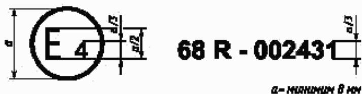
Образец А (см. 4.4.1 настоящих Правил)