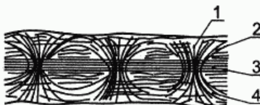
1 — вертикальное соединение; 2, 4 — слой волокон (прочес), 3 — каркас

Одеяло, изготовленное путем соединения слоев волокнистого прочеса с каркасом из нитей иглопробиванием его (каркаса) пучками волокон, захваченных иглами из прочеса. Обе стороны изготовленного таким образом одеяла могут быть ворсованными или неворсованными.