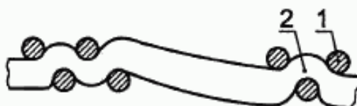
1 — нить основы ворсованная, 2 — нить утка ворсованная

Одеяло может иметь тканый рисунок с использованием переплетения определенного раппорта, например «оконный переплет». Одеяла могут быть ворсованными или неворсованными.