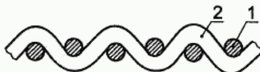
1 — нить утка, 2 — нить основы

Одеяло тканое гладкое может быть изготовлено вручную или машинным способом. Нити основы могут быть ворсовыми, объемными или необъемными.