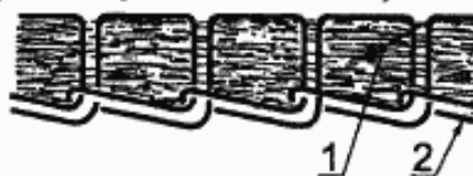
1 — волокнистый прочес, 2 — нити цепного стежка (переплетение «цепочка»)

Одеяло, образованное из волокнистого прочеса, роль связующего в котором выполняет цепной стежок (переплетение «цепочка»). Цепной стежок образует закрытые петли вдоль всего слоя прочеса. Обе стороны полученного одеяла (полотна) могут быть ворсованными или неворсованными.