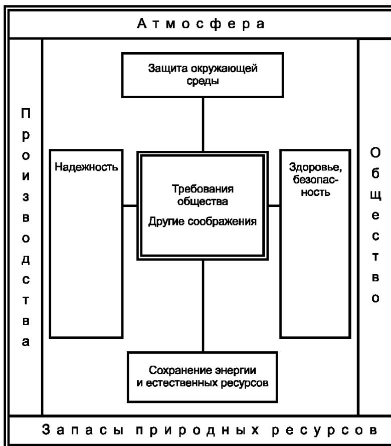
Рисунок 5.1 — Структурирование термина «Требования общества» (согласно ИСО 8402 [19]) внутри ядра информационно-графической модели стандартософии «ОКО ЗЕМНОЕ» [18, 20]