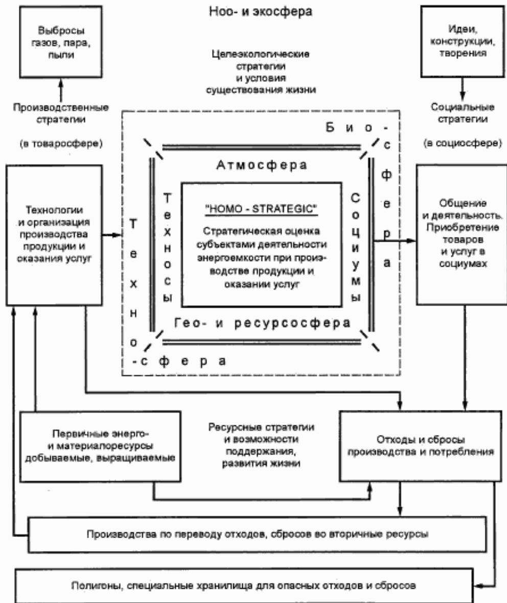
Рисунок А.1 — Стратегическая структуризация сфер жизнедеятельности общества во взаимодействии техносферы с биосферой. (Модель «HOMO-STRATEGIC» на основе ИСО 13600 [7])