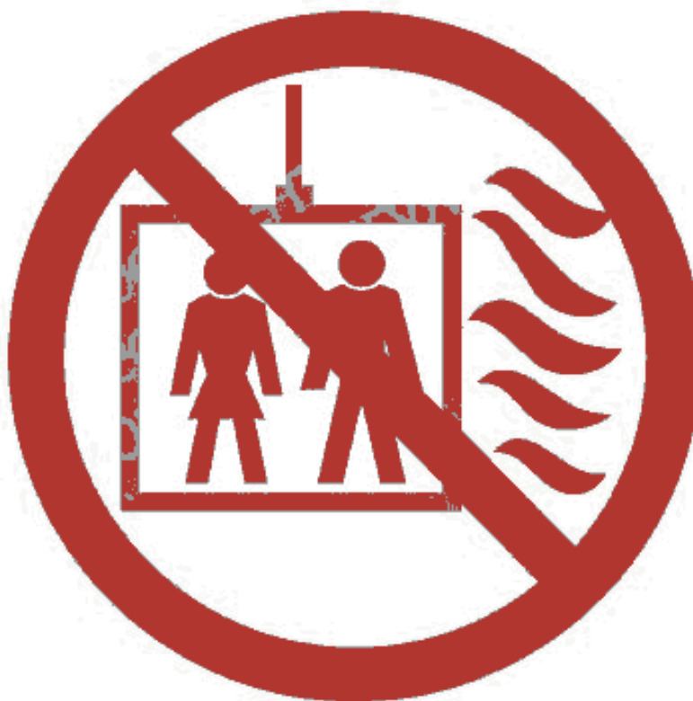
Рисунок 1 — Пиктограмма «Пользование лифтом во время пожара запрещено»

П р и м е ч а н и е — При необходимости на пиктограмме может быть приведен следующий текст: «Пользование лифтом во время пожара запрещено».