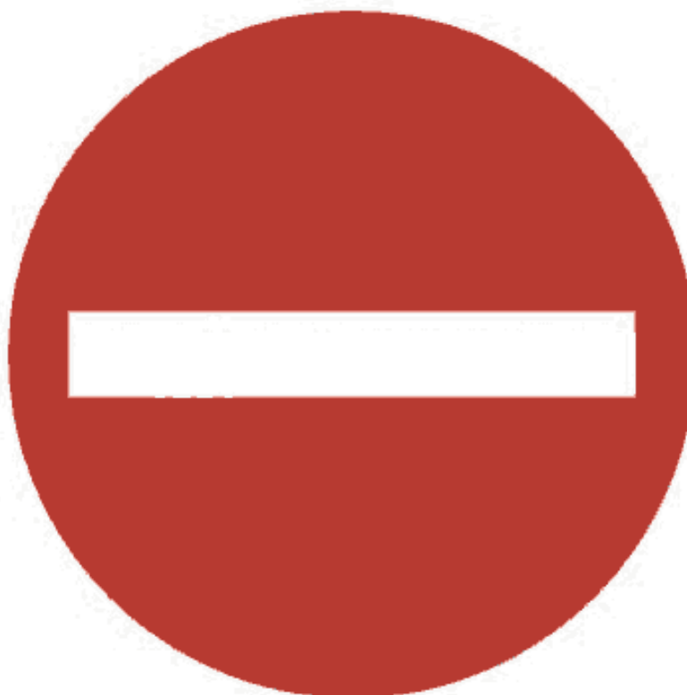
Рисунок 2 — Индикатор «Вход запрещен»