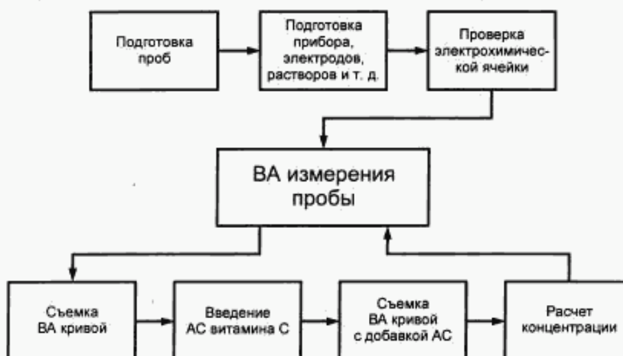
Рисунок 1 — Основные этапы анализа проб ВА методом

ВА метод анализа проб пищевых продуктов с целью определения массовой концентрации витамина С (аскорбиновой кислоты) состоит в проведении вольтамперметрических измерений раствора пробы после ее предварительной подготовки. Общая схема анализа представлена на рисунке 1.