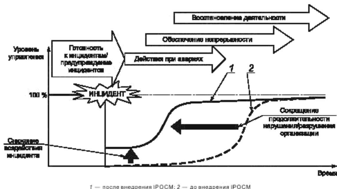
Рисунок 1 — Концепция готовности к инцидентам и IPOCM

Причастные стороны (заинтересованные стороны) требуют от организации быть заранее готовой к возможным инцидентам и нарушениям/разрушениям, чтобы не допустить приостановки критических видов деятельности, и, если произошла их полная остановка, быть способной быстро восстановить деятельность, поставку продукции и предоставление услуг (см. рисунок 1). Обеспечение готовности к инцидентам и непрерывности деятельности является процессом менеджмента, в рамках которого следует идентифицировать возможные негативные воздействия на организацию и создать структуру управления, направленную на минимизацию их воздействий.