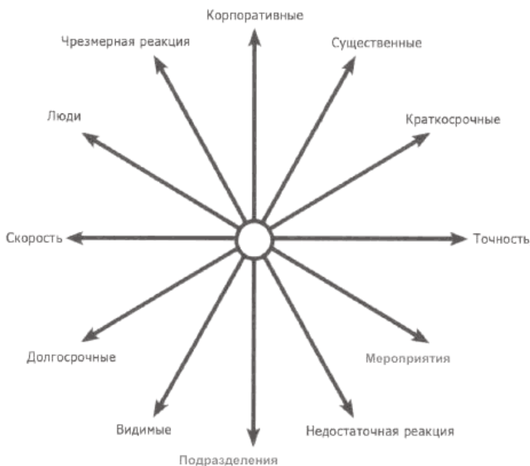
Рисунок 2 – Стратегические дилеммы в принятии решений

Например, могут быть важные дела, о которых знает менеджмент в условиях кризиса и которые должны быть выполнены (существенные, но менее заметные для СМИ или причастных сторон), но это может конфликтовать с необходимостью выполнить другие действия для демонстрации общего контроля, авторитета и укрепления доверия (что, возможно, менее важно, но более заметно). Точно так же курс действий с долгосрочной пользой может конфликтовать с курсом ожиданий общественности или сотрудников результатов в короткое время, что свидетельствовало бы о быстром решении.