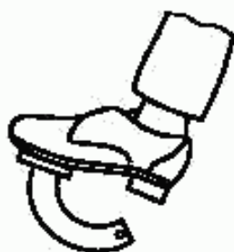
а) нажатие педали движением ноги (например, тормоз)