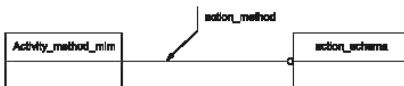
Рисунок D.1 — Представление IMM на уровне схем в формате EXPRESS-G

Графическая нотация EXPRESS-G определена в ИСО 10303-11, приложение D.