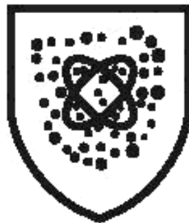
Рисунок 2 — Пиктограмма

6.3 Непосредственно на спецодежду следует наносить: