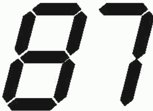
Рисунок 1 — Сегментированный дисплей