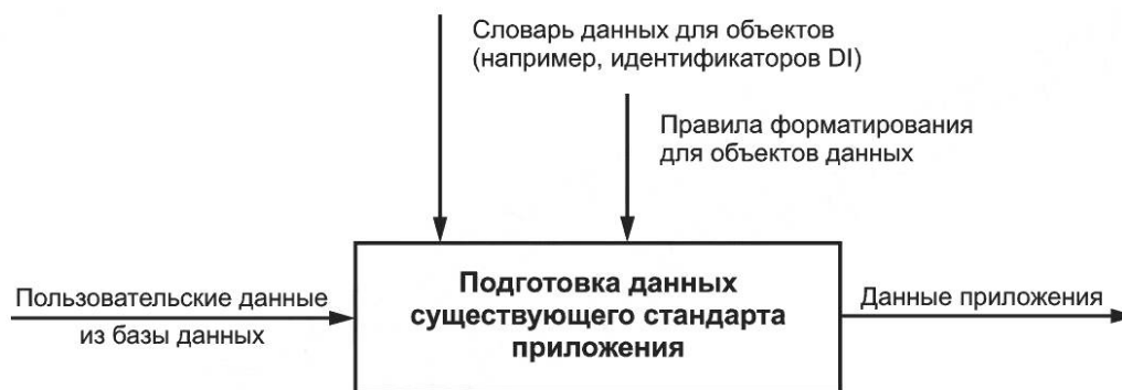
Рисунок В.1 — Модель потока данных: подготовка данных существующих стандартов приложений

Для некоторых основных приложений существуют несколько строгих правил для формирования допустимых данных. Для обеспечения соответствия этому формату при использовании существующего синтаксиса на основе сообщений существует программное обеспечение. Пользователи должны убедиться в том, что они реализуют метод записи данных на основе объектов, а сами данные следуют основным правилам. Рисунок В.1 иллюстрирует это схематически.