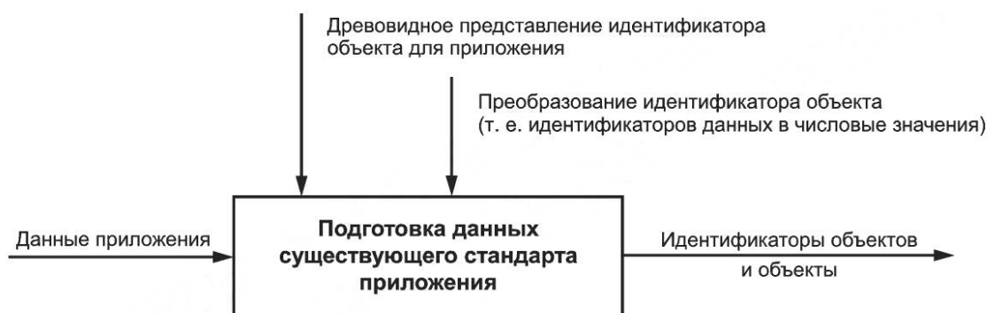
Рисунок 3 — Модель потока данных: подготовка базовых объектов

Любой такой словарь данных может совершенствоваться в течение определенного периода времени, и поддержка такого словаря данных не зависит от настоящего стандарта. Словарь данных обычно состоит из кодированного списка (числового, алфавитного, алфавитно-цифрового и т. д.) объектов данных и их спецификации для использования в предметной области стандарта приложения. ИСО/МЭК 15961-3 и связанный с ним регистр конструкций данных радиочастотной идентификации определяют идентификаторы объектов, которые относятся к приложениям.