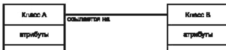
Рисунок D.2 — Иллюстрация связи между классами

Сплошная линия, проведенная между двумя представлениями классов, обозначает связь между данными классами. Рядом с этой линией помещается надпись, характеризующая сущность данной связи (см. рисунок D.2).