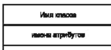
Рисунок D.1 — Представление классов на схемах

В языке UML класс изображается прямоугольником, ограниченным сплошными линиями, с тремя отделениями, разграниченными горизонтальными линиями. В верхнем отделении указывается имя класса, в среднем отделении приводится список атрибутов, а в нижнем — список операций.