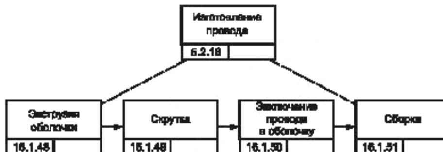
Рисунок В.6 — Блок-схема процесса изготовления проводов для изделия GT-350 [8]

Данное представление формализует спецификацию процесса, изображенного на рисунке В.6, а также использует soo_precedes для указания ограничений элементов субопераций экструзии оболочки, скрутки проводов, заключения проводов в оболочку и сборки. Неформально каждая из стрелочек, изображенных на рисунке В.6, соответствует soo_precedes . Soomap используют для различения любых возможных элементов субопераций.