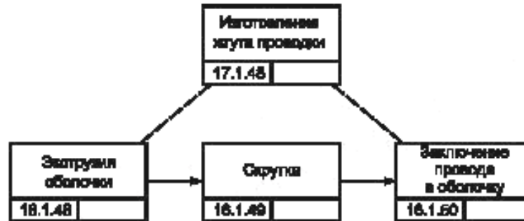
Рисунок В.5 — Блок-схема процесса изготовления жгутов проводки [8]