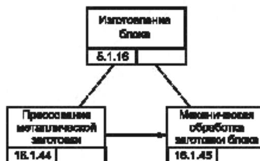
Рисунок В.3 — Блок-схема процесса изготовления блока цилиндров изделия GT-350 [8]

Блок цилиндров изделия GT-350 изготавливают в виде под сборки двигателя этого изделия, что предусматривает работы литейного производства и цеха механообработки (см. рисунок В.3).