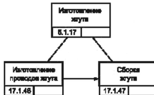
Рисунок В.4 — Блок-схема процесса изготовления жгута для изделия GT-350 [8]

Передаточный механизм изделия GT-350 изготавливают в виде под сборки двигателя этого изделия, что предусматривает работы кабельной мастерской (см. рисунок В.4). Рисунок В.5 более подробно иллюстрирует процесс изготовления жгутов, сборку которых выполняет монтажник в кабельной мастерской, что занимает у него 10 мин на один комплект.