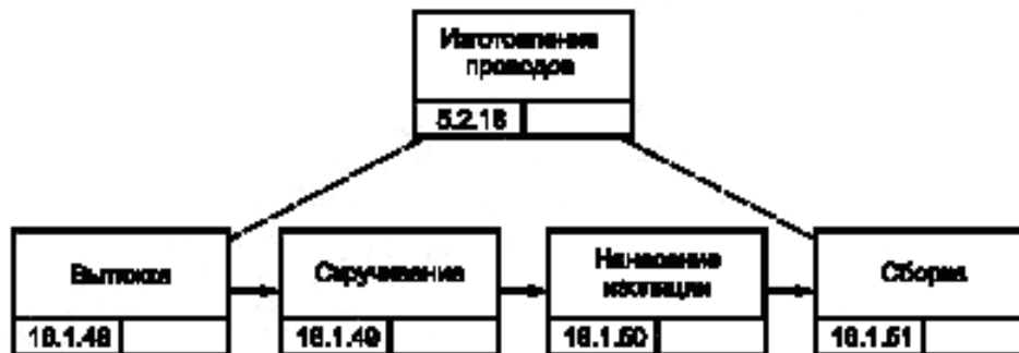
Рисунок В.6 — Процесс изготовления проводов изделия GT-350

Набор проводов изделия GT-350 изготавливают как сборочный агрегат изделия GT-350. Технологический процесс организуют в цехе проводов и кабелей (см. рисунок 6).