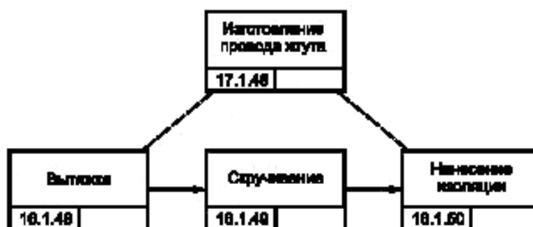
Рисунок В.5 — Процесс изготовления провода жгута

Составляющее действие «assemble_harness» (сборка жгута) имеет входное условие, в соответствии с которым сборка следует за изготовлением проводов жгута (make_harness_wires), поэтому данное действие является событийно ограниченным (occurrence_constrained).