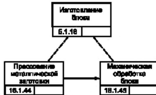
Рисунок В.3 — Процесс изготовления блока изделия GT-350

Представление некоторых действий и технологических данных на языке PSL (внешнее ядро):