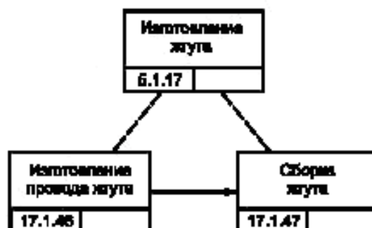
Рисунок В.4 — Процесс изготовления жгута изделия GT-350

Жгут изделия GT-350 (см. рисунок В.4) изготавливают как сборочный агрегат двигателя изделия GT-350. Данный технологический процесс организован в цехе кабелей и проводов. Рисунок В.5 представляет процесс изготовления провода жгута. Жгут изделия GT-350 собирают на особом стенде из проводов и кабелей. Сборка одного жгута требует 10 мин.