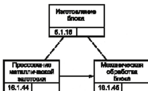
Рисунок В.3 — Процесс изготовления блока изделия GT-350 [4]

Блок изделия GT-350 выполняется как агрегат для сборки двигателя изделия GT-350. Изготовление блока требует выполнения всех технологических операций, начиная от литья заготовки и ее механической обработки (см. рисунок В.3).