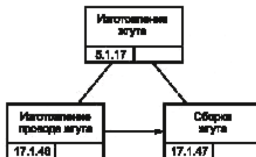
Рисунок В.4 — Процесс изготовления жгута изделия GT-350 [4]

Жгут изделия GT-350 (см. рисунок В.4) изготавливается как сборочный агрегат двигателя изделия GT-350. Данный технологический процесс организован в цехе кабелей и проводов. Жгут изделия GT-350 собирается на особом стенде из проводов и кабелей. Сборка одного жгута занимает 10 мин.