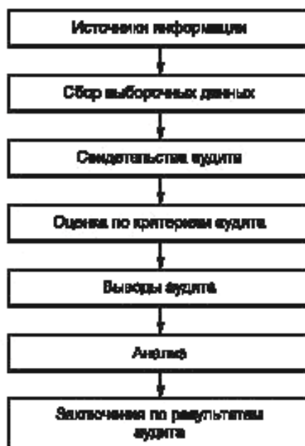
Рисунок 3 — Блок-схема процесса, начиная от сбора информации до получения заключений по результатам аудита