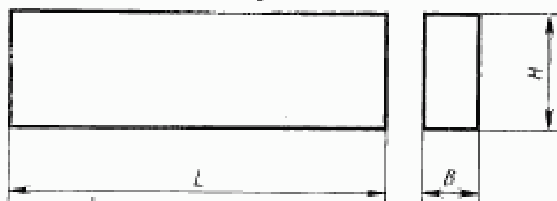
Черт. 1 Размеры в мм