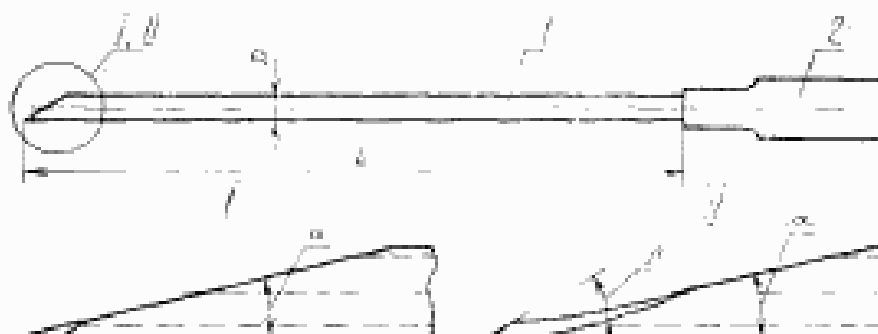
1—головка; 2—труба Черт. 1

1.4. Основные размеры игл должны соответствовать указанным на черт. 1 и в табл. 1—3.