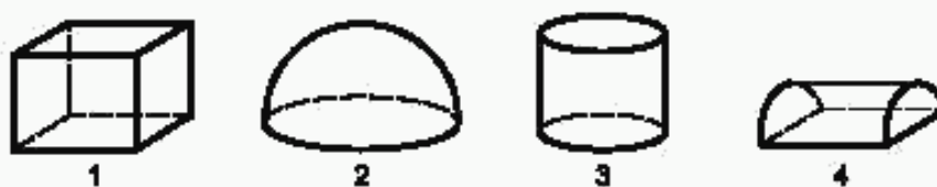
1 — параллелепипед; 2 — полусфера; 3 — цилиндр; 4 — полуцилиндр.

Примечание — Предпочтительно выбирать поверхности простых геометрических форм, представленных на рисунке 1.