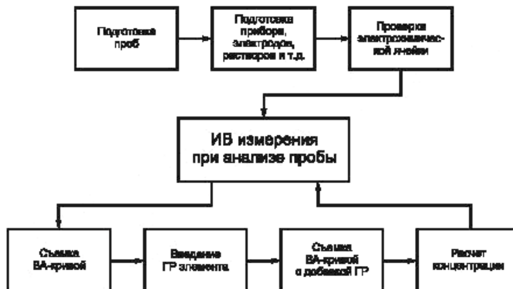
Рисунок 1 — Основные этапы анализа проб методом ИВ

ном минус 1,0 В отн. ХСЭ. Процесс электрорастворения мышьяка (0) с поверхности электрода проводят при линейном или дифференциально-импульсном режиме изменения потенциала в положительную сторону до потенциала растворения золота. Потенциал анодного пика мышьяка находится в интервале от +0,01 до +0,05 В при рН раствора 3—4.