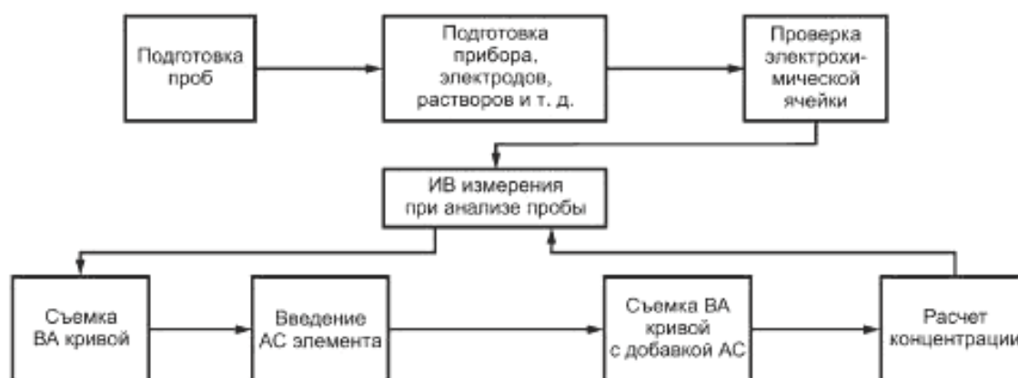
Рисунок 1 — Основные этапы анализа проб ИВ методом

ИВ метод измерений основан на способности иодид-ионов накапливаться на поверхности РПЭ в виде малорастворимого соединения со ртутью при определенном потенциале с последующим катодным восстановлением осадка при изменении потенциала. Аналитическим сигналом является величина катодного тока пика при потенциале минус (0,30 \pm 0,05) В, который пропорционален концентрации иодид-ионов. Массовую концентрацию иодид-ионов рассчитывают по методу добавки АС иодид-ионов. Общая схема анализа проб ИВ методом представлена на рисунке 1.