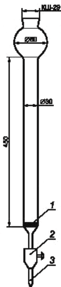
1 — фильтр Шотта; 2 — фторопластовый кран; 3 — стеклянный наконечник

Б.1 Колонки для анализа приведены на рисунках Б.1—Б.4