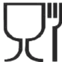
Рисунок А.1 – Для контакта с пищевой продукцией

А.2 Символ, характеризующий изделие по назначению, наносят на упаковочный ярлык или упаковочный лист (вкладыш) или указывают в сопроводительной документации – см. рисунок А.1.