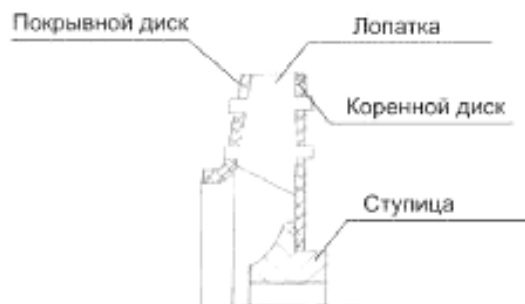
Рисунок А.7 – Крепление лопаток радиальных вентиляторов с помощью шипов