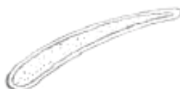
Рисунок А.5 – Объемная наполненная лопатка рабочего колеса вентилятора