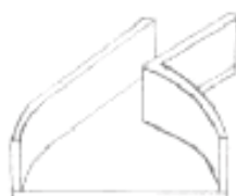
Рисунок А.2 – Сборный способ изготовления корпуса вентилятора