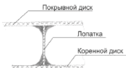
Рисунок А.6 – Крепление лопаток радиальных вентиляторов с приформовкой