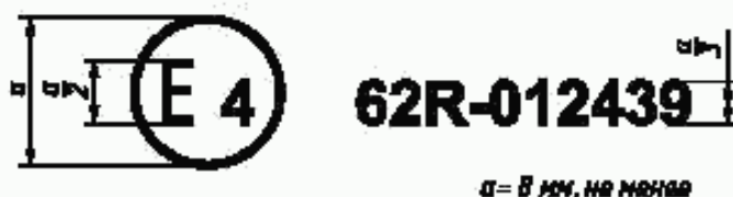
Образец А (См. 4.4 настоящих Правил)

Приведенный выше знак официального утверждения, проставленный на транспортном средстве, указывает, что этот тип транспортного средства официально утвержден в Нидерландах (E4) в соответствии с Правилами ЕЭК ООН № 62 в отношении защиты транспортного средства от угона. Номер официального утверждения указывает на то, что официальное утверждение было предоставлено в соответствии с требованиями Правил ЕЭК ООН № 62 в их первоначальной форме.