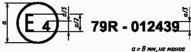
Образец А (см. 4.4)

Приведенный выше знак официального утверждения, проставленный на транспортном средстве, указывает, что этот тип транспортного средства официально утвержден в Нидерландах (Е 4) в отношении механизмов рулевого управления на основании Правил ЕЭК ООН № 79 под номером 012439. Этот номер официального утверждения означает, что официальное утверждение было предоставлено в соответствии с требованиями Правил ЕЭК ООН № 79 с внесенными в них поправками серии 01.