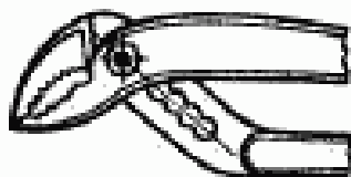
Исполнение 2 в