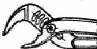
Исполнение 3 в