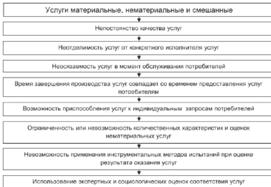
Рисунок 2 — Специфические особенности услуг

Поэтому при разработке и внедрении системы менеджмента качества в организациях, предоставляющих услуги населению, необходимо учитывать особенности сферы услуг.