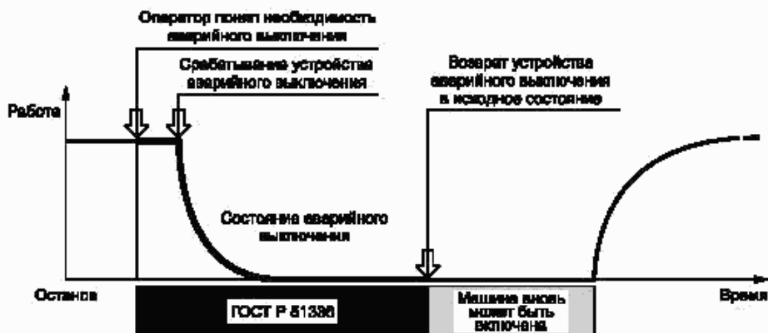
Рисунок 1 — Функциональные аспекты применения ГОСТ Р 51336

Рисунок 1 показывает принципы функционирования системы аварийного выключения.