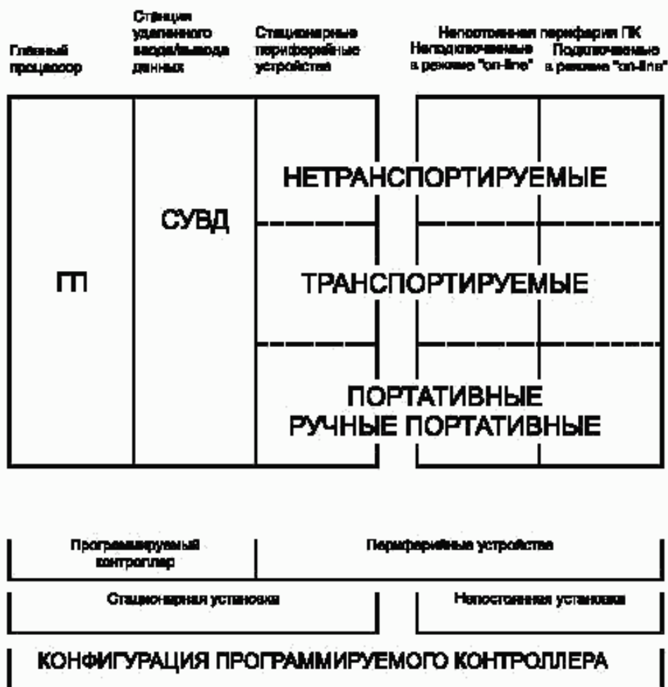
Рисунок А.1 — Конфигурация программируемого контроллера

На рисунке А.1 показана связь между определениями, относящимися к техническим средствам программируемых контроллеров.