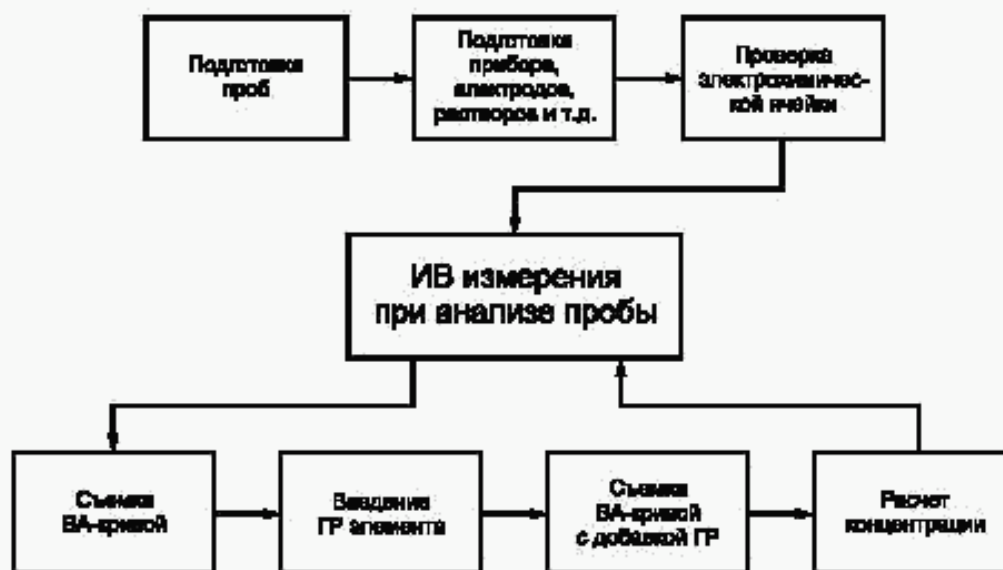
Рисунок 1 — Основные этапы анализа проб методом ИВ

Метод ИВ измерений основан на способности элемента электрохимически осаждаться на индикаторном электроде из анализируемого раствора при заданном потенциале предельного диффузионного тока, а затем растворяться в процессе анодной поляризации при определенном потенциале, характерном для данного элемента. Регистрируемый на вольтамперограмме аналитический сигнал элемента пропорционален его концентрации.