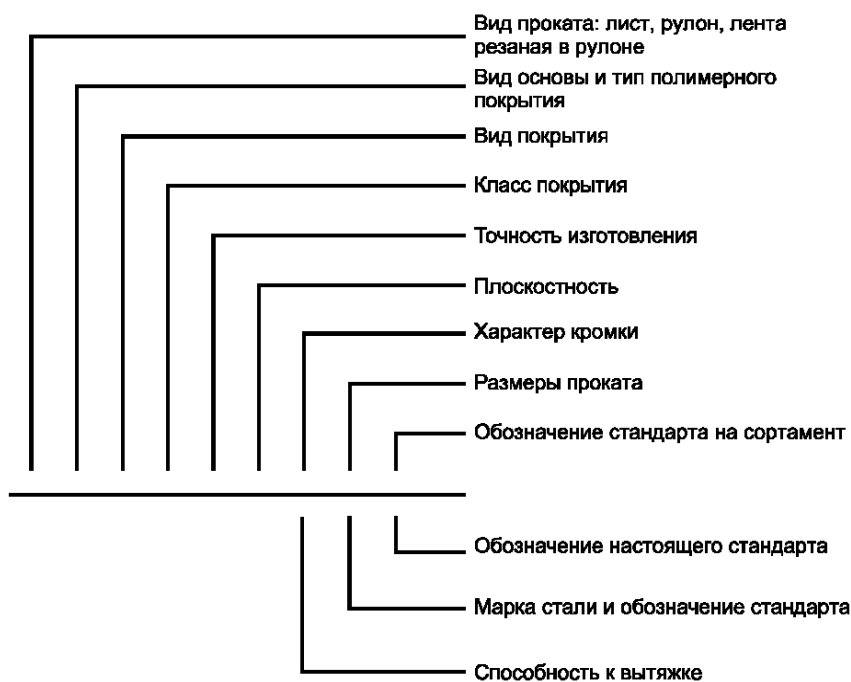
Схема условных обозначений проката с полимерным покрытием

Примечание — При отсутствии какого-либо из параметров его выбирает предприятие-изготовитель.