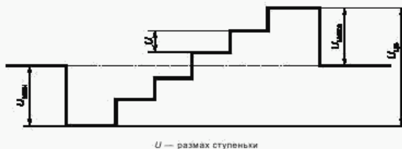
Рисунок 4 — Осциллограмма сигнала для измерения параметров каналов цветности

Значения параметров U_{цв} и U_{эфф} измеряют с использованием сигнала, представленного на рисунке 4.