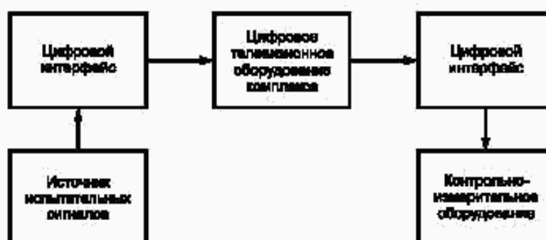
Рисунок 3 — Схема измерения параметров студийного (внестудийного) комплекса

8.4 Измерения параметров цифрового телевизионного студийного (внестудийного) комплекса проводят по схеме, приведенной на рисунке 3.