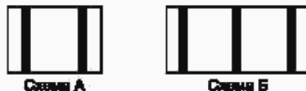
Рисунок 2 — Схема отбора проб кукурузы в початках

6.3.5 Для определения состава вороха початков кукурузы с площади длиной 0,5 м, шириной, равной ширине насыпи, по всей ее высоте отбирают пробы с подбором свободного зерна. Из автомобилей (прицепов), вагонов пробы отбирают в двух местах, в буртах — в трех местах согласно рисунку 2.