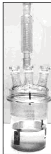
Рисунок 3 — Реакционный сосуд с парциальным конденсатором

4.2.3.7 После окончания испытания металлические образцы промывают и очищают щеткой с синтетической или натуральной щетиной (неметаллической). Остатки, которые невозможно удалить механическим путем (появившиеся продукты коррозии или отложения), удаляют с помощью ингибированных растворов для травления.