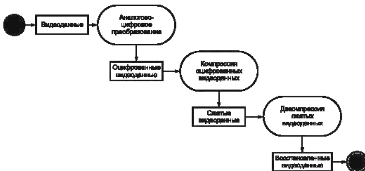
Рисунок 1 — Общая схема работы ЦСОТ

Общая схема работы ЦСОТ с точки зрения использования алгоритмов компрессии и декомпрессии представлена на рисунке 1.