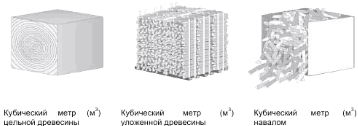
Рисунок В.1 – Сравнение различных кубических метров

Примечание — Три кубических метра навалом примерно соответствуют двум кубическим метрам уложенной древесины.