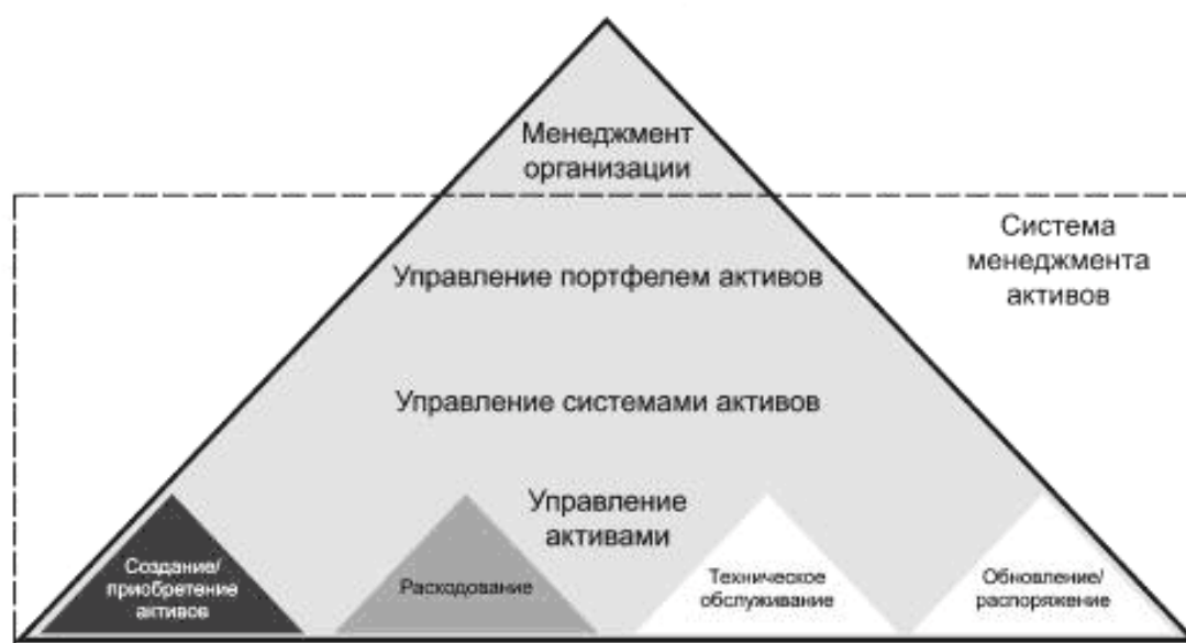
Рисунок 3 — Уровни управления активами в системе менеджмента активов

Исследование устойчивости системы активов является одним из способов оптимизации процесса принятия решений. Крупные организации могут иметь диверсифицированный портфель систем активов, который содействует достижению целей организации и обеспечивает широкий диапазон инвестиционных возможностей, вариантов производительности и видов риска. Для реализации скоординированного и оптимизированного подхода к диверсификации и комплексности активов в соответствии с целями, приоритетами и выбранным профилем риска организации важную роль играет интегрированная система менеджмента активов.