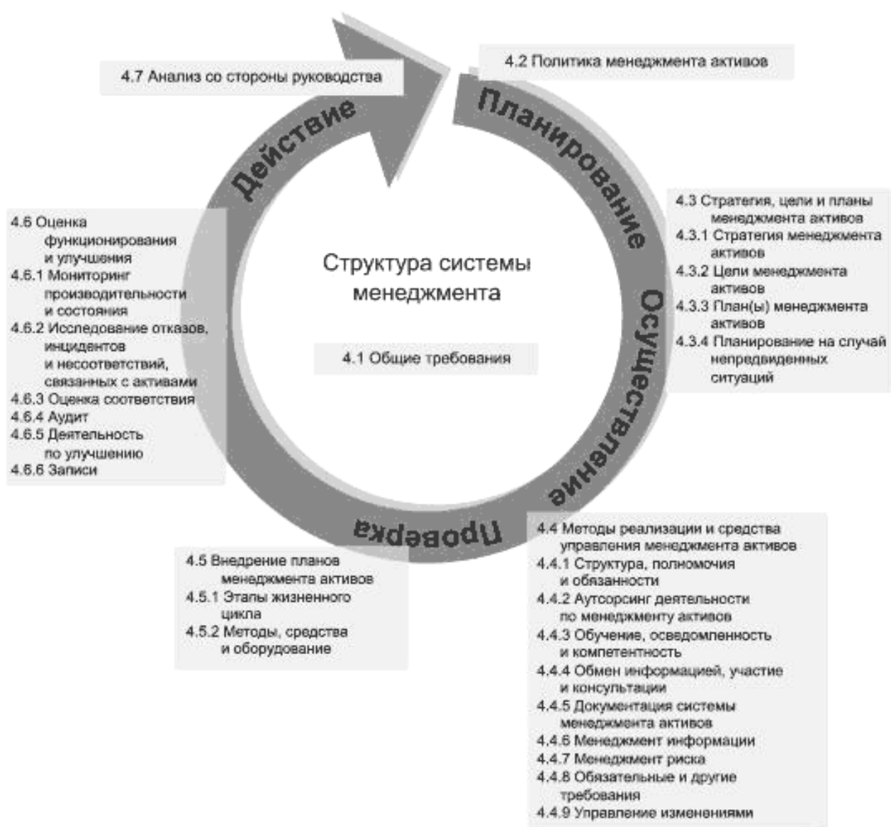
Рисунок 6 — Структура системы менеджмента активов