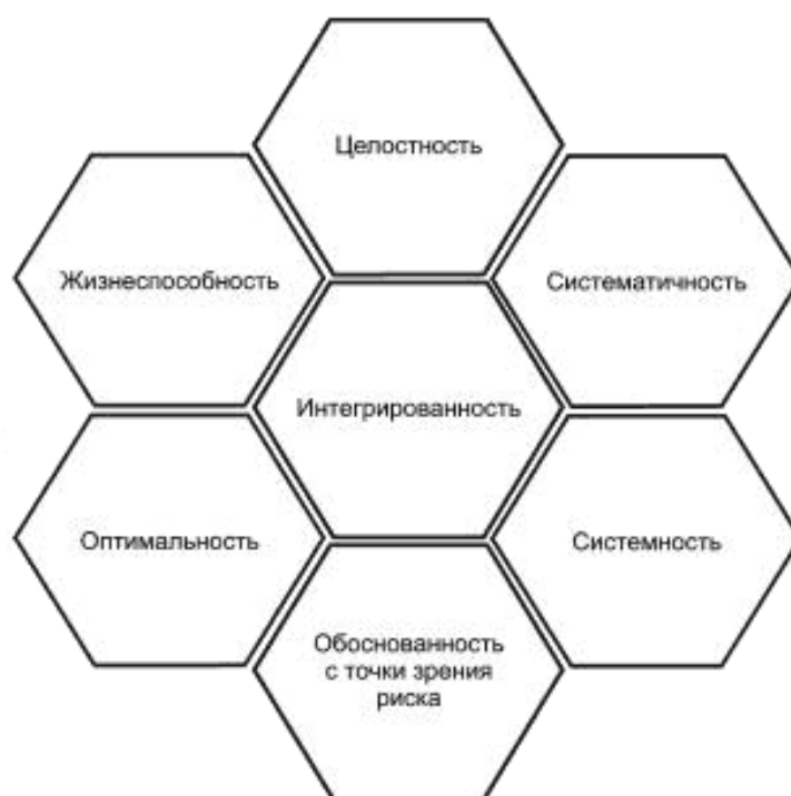
Рисунок 1 — Основные принципы и характеристики менеджмента активов