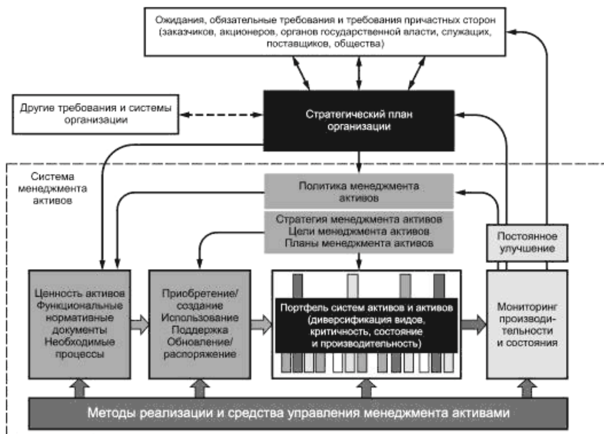
Рисунок 4 — Краткая схема системы менеджмента активов, ее связи со стратегическим планом организации и ожиданиями причастных сторон

Связь стратегического направления развития организации с постоянными действиями по управлению активами является жизненно важным компонентом системы менеджмента активов. Эта связь помогает согласовать устремления «верхних уровней» организации с фактическим состоянием и возможностями использования активов на «нижних уровнях». На схеме, представленной на рисунке 5, показано важное значение планирования и внедрения элементов системы менеджмента активов, обеспечивающих взаимодействие верхних и нижних уровней системы.