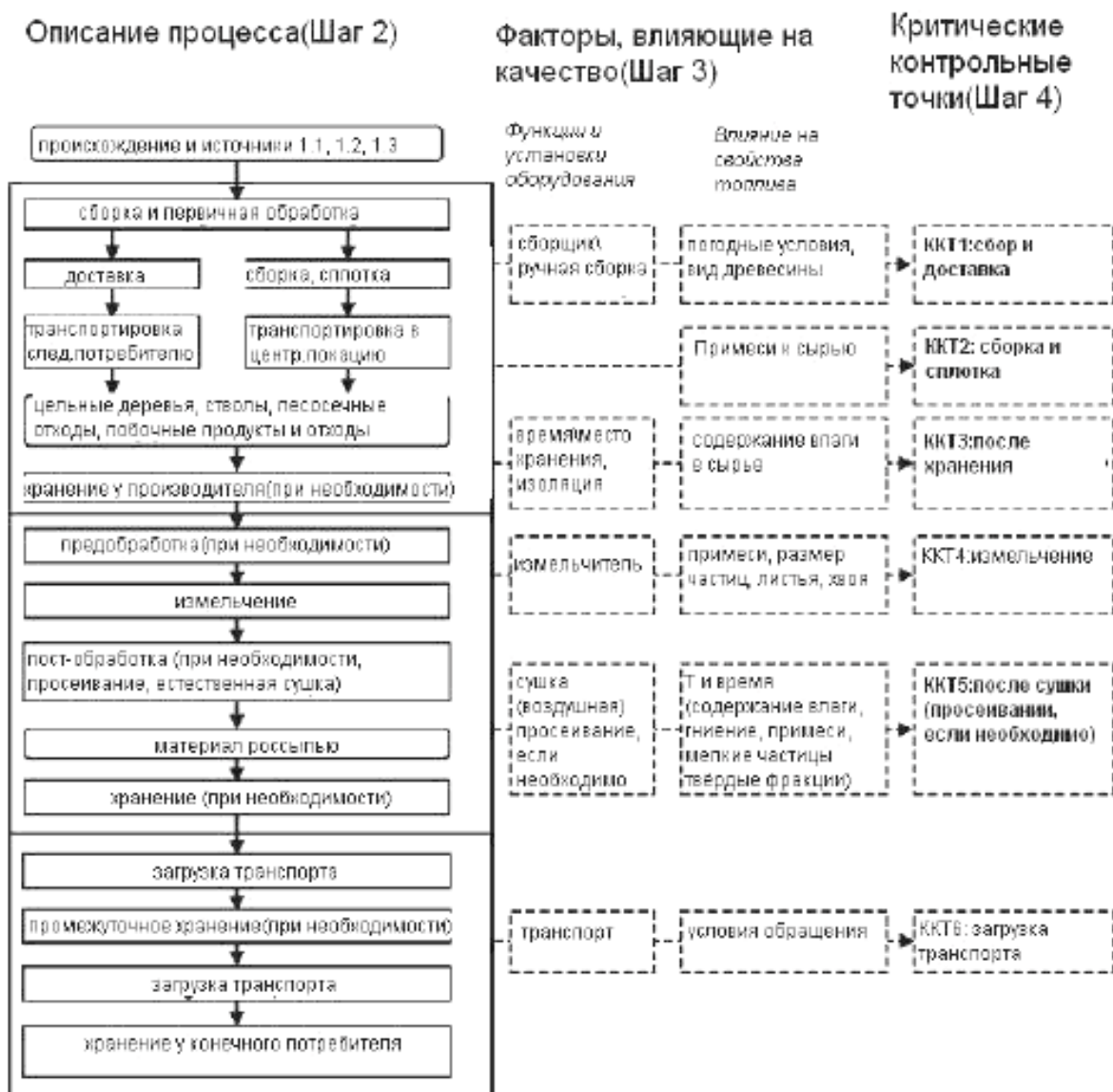
Схема 2 – Пример описания процесса производства с факторами, влияющими на качество, и критическими контрольными точками

Примеры описания процесса, включая соответствующие факторы, влияющие на качество, и критические контрольные точки (ККТ) приведены в схеме 2.