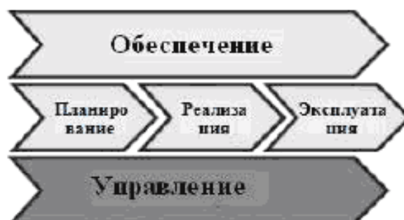
Рисунок 2 – Основные компоненты бизнес-процессов в ИКТ

2. Бизнес-процессы в ИКТ имеют основные компоненты: планирование, реализация, эксплуатация, обеспечение, управление. Этапы реализации и эксплуатации являются основными, этапы обеспечения и управления пронизывают их, связывая между собой. Этапы планирования и обеспечения являются стратегическими этапами для компаний, которые предлагают и разрабатывают решения, конфигурируют и разрабатывают продукты, сервисы, виды деятельности и правила. Этапы реализации и эксплуатации сопровождают ежедневную деятельность по управлению и улучшению бизнеса.