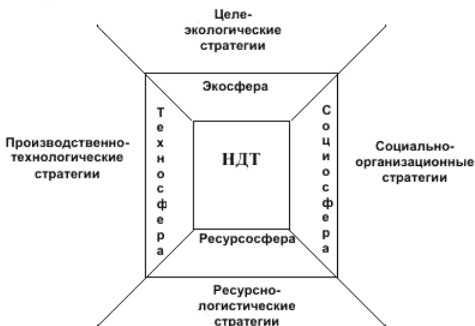
Рисунок 1 — Модель «Стратегии и наилучшие доступные технологии (НДТ)»

Такая структура позволяет использовать «Модель «Стратегии и наилучшие доступные технологии (НДТ)» (рисунок 1), охватив в настоящем стандарте все четыре блока стратегий (производственно-технологических в техносфере, идентификационно-ресурсных в ресурсосфере, социально-экономических в социосфере и целе-экологических в экосфере). Эти четыре блока стратегий являются «рамочными» стратегическими ограничениями (ГОСТ Р 51750) любой хозяйственной деятельности при одновременном учете способствующими обеспечению ее устойчивости.