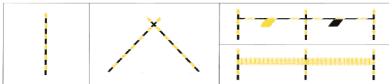
Веха желтая и черная простая